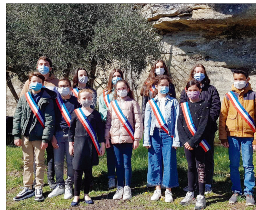
Nos jeunes élus sont :