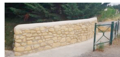
Muret entrée lotissement le Clos des Vignes