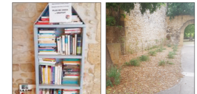
Ruches à livres square de la Paix et Paillage salle polyvalente "Michel PAULIN"