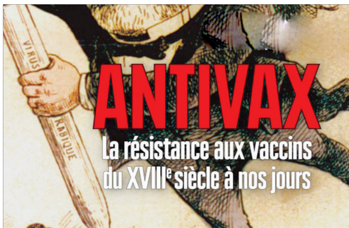
Un essai signé par Françoise Salvadori et Laurent-Henri Vignaud

des crues de l'ardèche du 10 mai 2021. Si vous souhaitez l'aider, une cagnotte Leetchi a été ouverte en ligne à cette adresse : https://www.leetchi.com/c/aidez-un-apiculteur-en-difficulte